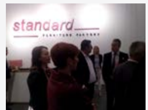
Posjeta štandu firme Standard Furniture Factory