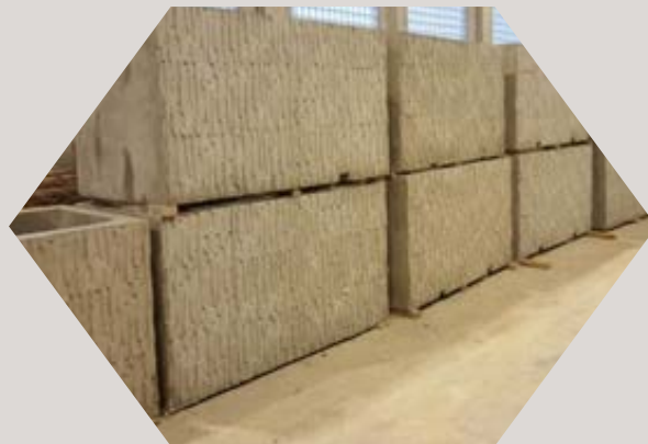
AB gabioni sa strukturom