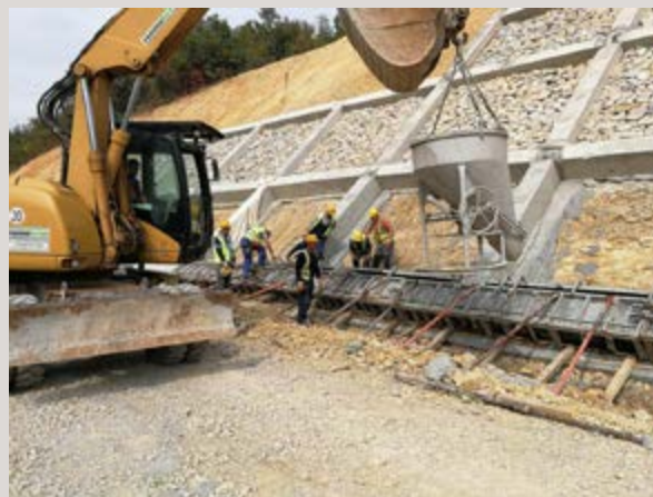
Izgradnja autoceste - roštiljska konstrukcija

U toku 2011. godine izvršili smo edukaciju i dobili certifikate za Sistem upravljanja kvalitetom, okolinom i zaštitom zdravlja i sigurnosti na radu, u skladu sa zahtjevima standarda EN ISO 9001:2008; i EN ISO 14001:2009, te kontinuirano nastavili recertificirati iste.