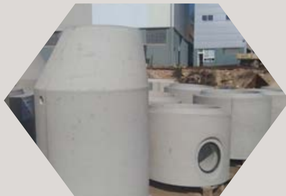
Savremena tehnologija za proizvodnju PERFECT betonskih šahtova