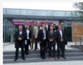
Posjeta Privrednoj komori Lippe zu Detmold