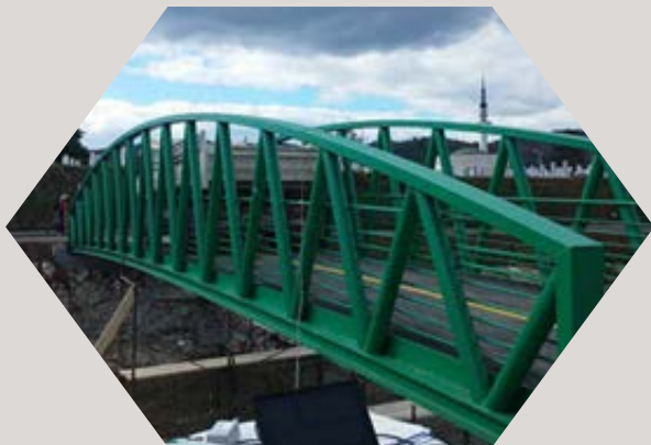
Pješački most na rijeci Misoči u Ilijašu