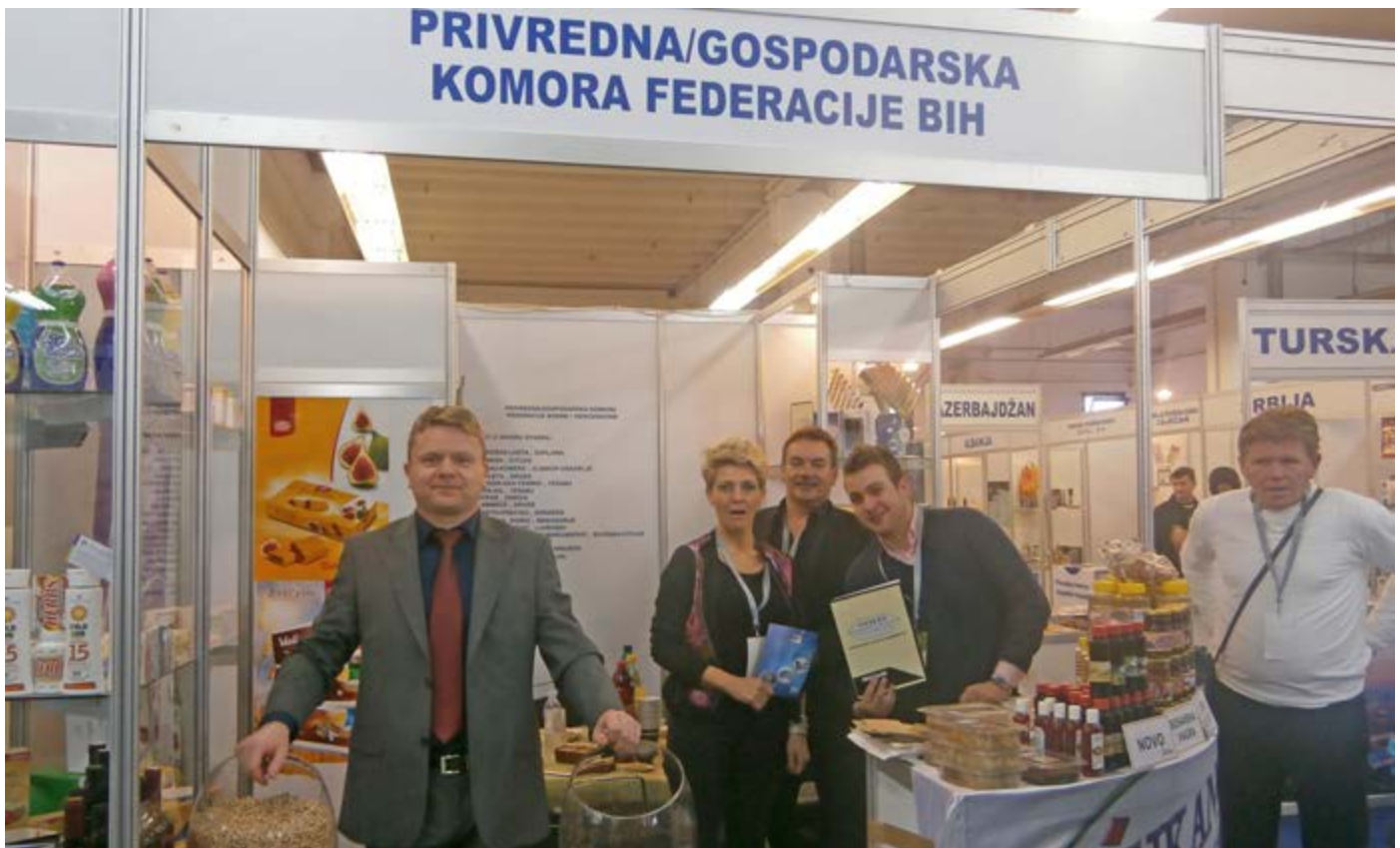
gospodarstvenici iz FBiH

Na 20. “VIROEXPO-u” izlagao je 731 izlagač iz 26 zemalja, od čega 232 izlagača iz 25 stranih zemalja: Albanije, Austrije, Azerbajdžana, Belgije, BiH, Crne Gore, Češke, Francuske, Indije, Italije, Kazahstana (koji se predstavio prvi put na sajmu), Kine, Kosova, Mađarske, Makedonije, Nizozemske, Njemačke, Poljske, Rusije, Slovačke, Slovenije, Srbije, Švedske, Turske i Ukrajine te izlagači iz Hrvatske. Najviše izlagača iz stranih zemalja bilo je iz BiH 86 i svi su izlagali u organizaciji gospodarskih komora FBiH, Tuzle, Bihaća, Brčkog i Doboja.