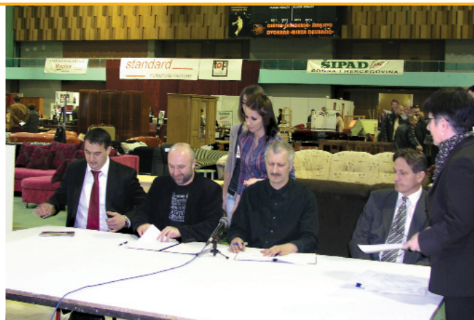
Potpisivanje protokola o saradnji