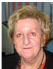
Piše: mr. Nafija ŠEHİĆ-MUŠIĆ

Najvažnijim faktorima globalnog razvoja, uz mir i sigurnost, demokratizaciju društva i unapređenje ljudskih prava, danas se smatraju zaštita okoliša i ekonomski razvoj. Stoga je od prvorazrednog značaja za BiH da, u tranzicijskom periodu, u što većem obimu, koristi iskustva okolinske tranzicije zemalja koje su prošle tu fazu