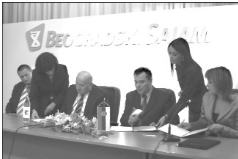
Potpisivanje Memoranduma o razumijevanju

Centralni događaj za ovu komoru svakako je potpisivanje Memo-