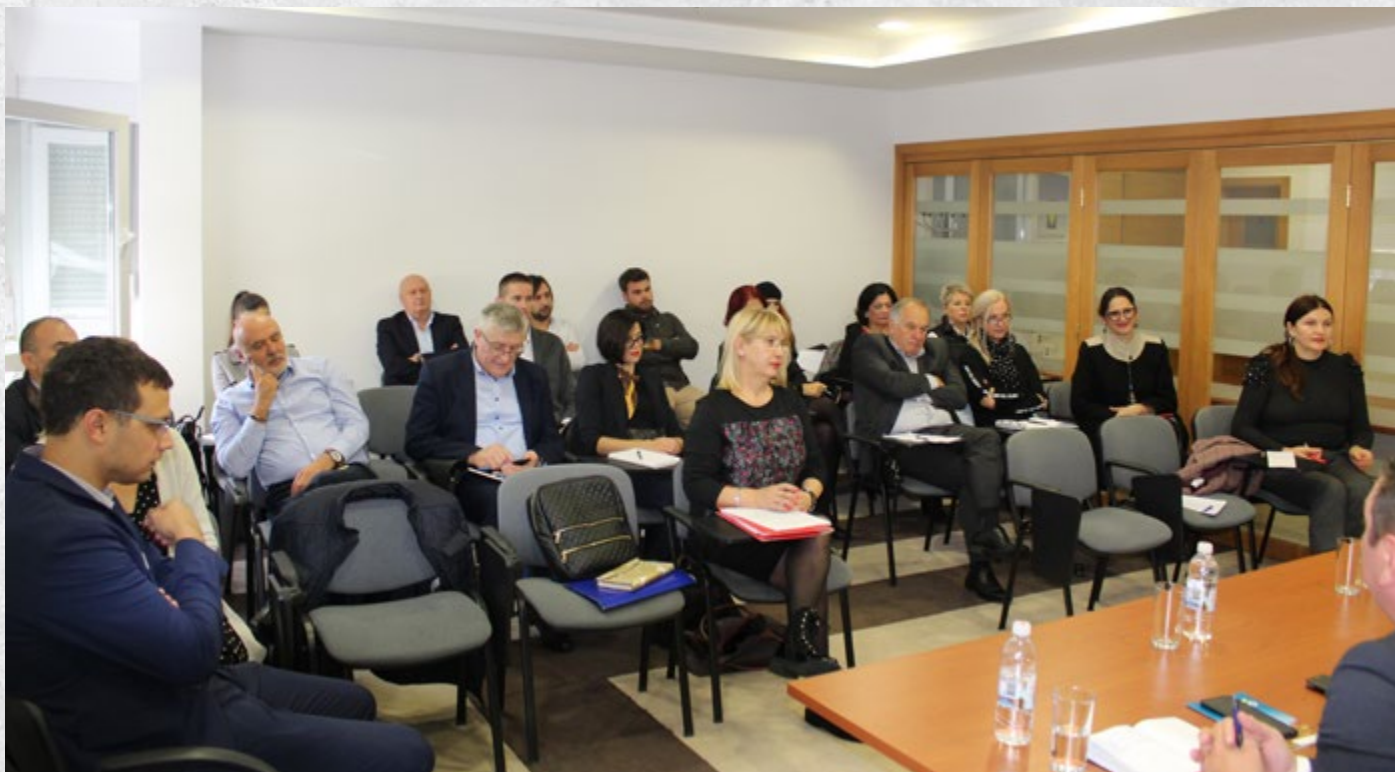
Okrugli sto u Mostaru

situacija u ovom sektoru i dale smjernice za budući razvoj, ali također i da bi se omogućio pristup sredstvima iz raspoloživih međunarodnih izvora. Učesnici okruglih stolova naglasili su da je, uporedo sa usvajanjem novih zakona, potrebno pristupiti izradi strategije te da je od posebnog značaja da u taj proces budu uključeni ključni akteri – privrednici, domaći stručnjaci, turistička udruženja i privredne komore, turističke zajednice i relevantne institucije na svim nivoima.