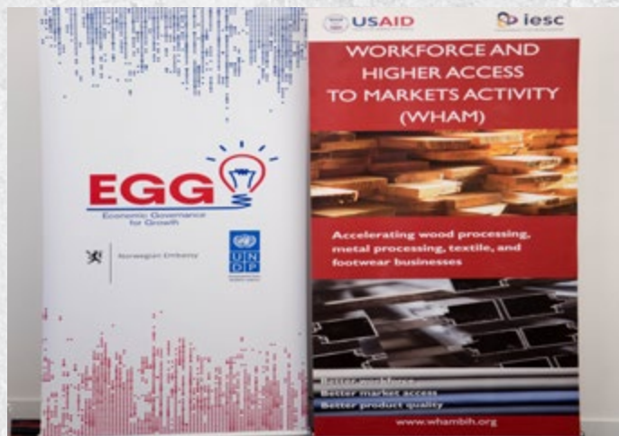
Foto: IV poslovni forum organizovan je uz sponzorsku podršku USAID WHAM projekta i UNDP-a

IV Poslovni forum organiziran je pod pokroviteljstvom Premijera Vlade FBiH, te uz sponzorsku podršku USAID WHAM projekta, UNDP-a, kao i kompanija Porsche BH, Hager Bosnia i Cromex d.o.o.