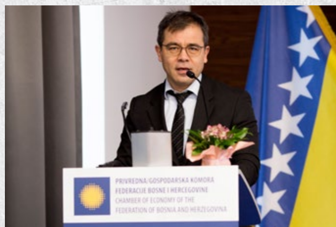
Foto: Zamjenik rezidentne predstavnice UNDP-a gosp. Khoshmukhamedov

Na Forumu je predstavljena studija UNDP-a Analiza bosanskohercegovačke industrije - trendovi, izazovi i razvojne prilike, koja je osnova za dalji razvoj ove grane industrije. Zamjenik rezidentne predstavnice UNDP-a gosp. Sukhrob Khoshmukhamedov istakao je da su tehnološke promjene u automobilskoj industriji jedan od važnih segmenata pomenute Studije, kao i primjena istih u BiH. Studiju je predstavio gosp. Szymon Zielinski, ekspert firme Price Waterhouse Cooper Poljska.