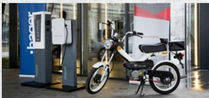
Foto: Električni motor firme Cromex d.o.o. i električni punjači firme Hager Bosnia

mobilske industrije FBiH, kako bi se nastavili pozitivni trendovi razvoja domaće autoindustrije. Promjene koje se dešavaju u svjetskoj automobilskoj industriji, a to je težnja da se vozila na konvencionalni pogon zamijene pogonom na električnu energiju, treba posmatrati kao šansu i izazov. Kroz Ured Grupacije automobilske industrije u Wolfsburgu, potrebno je nastaviti sa radom na promociji, povezivanju i boljem pristupu tržištu bh. firmi. Od ključnog značaja je nastavak sistemskog djelovanja svih partnera projekta (Vlade FBiH, USAID-a, UNDP-a, itd.) na podizanju konkurentnosti domaće privrede kroz trajnu edukaciju, standardizaciju i certifikaciju, što je preduvjet za veće učešće domaćih proizvođača na tržištu EU. Privredna/Gospodarska komora FBiH ističe posebno zadovoljstvo što je ovogodišnji Forum okupio predstavnike vodećih domaćih kompanija i svjetskih brendova u automobilskoj industriji, predstavnike vlada, relevantnih institucija i međunarodnih organizacija te vrhunske stručnjake iz oblasti automobilske industrije i pametnih tehnologija.