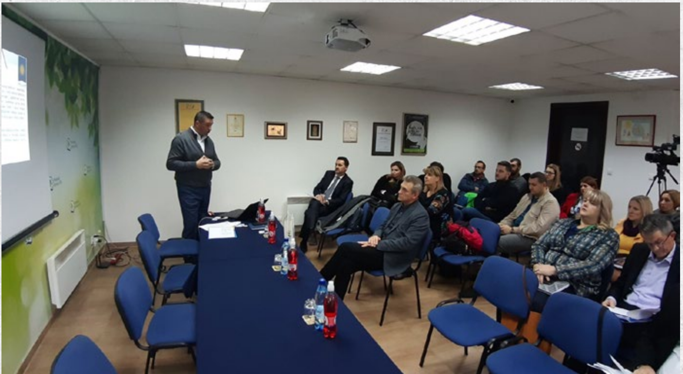
Okrugli sto u Bihaću

Okrugli stolovi održani su krajem novembra mjeseca u tri grada Federacije BiH – Bihaću, Mostaru i Sarajevu. Cilj okruglih stolova bio je da se objedine primjedbe i prijedlozi privrednika iz navedenih sektora, predstavnika turističkih zajednica, udruženja te institucija vezano za postojeću zakonsku regulativu i nacрте Zakona o turizmu FBiH i Zakona o ugostiteljstvu FBiH, te identificiraju glavne prepreke sa kojima se susreću u svom radu.