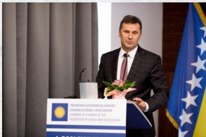
Foto: Uvodno obraćanje premijera FBiH gosp. Novalića

U svom obraćanju na Forumu, premijer Federacije BiH gosp. Fadil Novalić naglasio je kako automobilska industrija u BiH ima dugogodišnju tradiciju, te da bez obzira na razaranja u ratnom periodu ovaj sektor karakteriše dinamičan razvoj i snažna izvozna orijentacija. Napomenuo je da je automobilska industrija pogodno tlo za primjenu svih dostignuća četvrte industrijske revolucije.