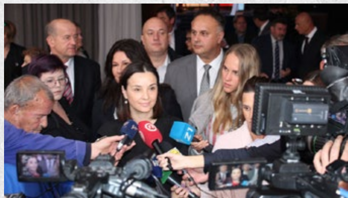
Pripremio: Dario Planinić dipl.ecc.

Osim zajedničkog izlagačkog štanda na Ambienti su se samostalno predstavile i kompanije ARTISAN, DIVAN I STILL. Kvalitet bh proizvoda u ovom sektoru je potvrđeni nagradom koju je dobio ARTISAN za dizajn po izboru novinara.