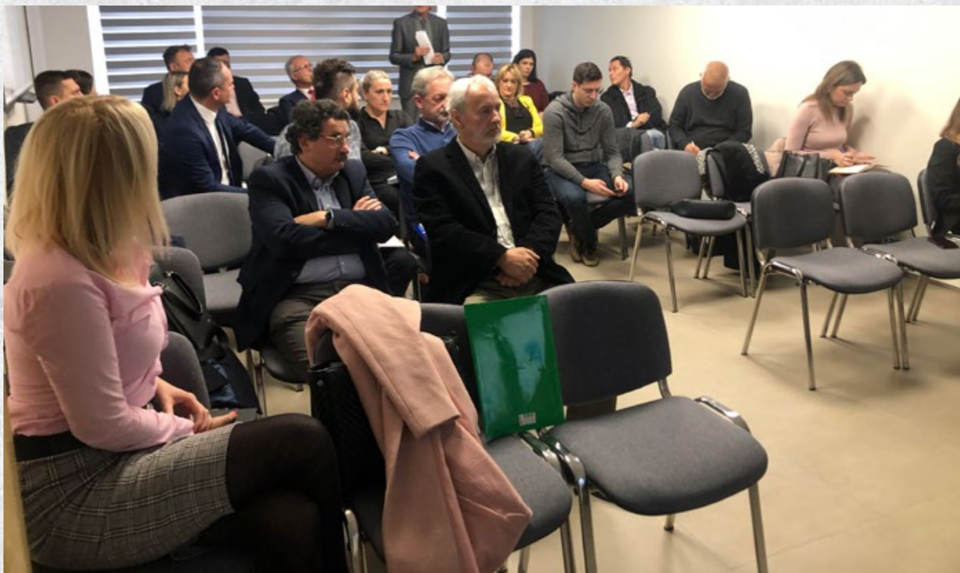
Okrugli sto u Sarajevu

Obzirom na nelojalnu konkurenciju stranih agencija, ali i lokalnih subjekata koji rade bez odgovarajućih dozvola, traženo je da se kroz nove zakonske propise predvidi obaveza angažovanja lokalnog vodiča odnosno agencije za realizaciju organizovanih turističkih putovanja u BiH. Takva obaveza postoji u drugim zemljama, uključujući i zemlje regije, zaštitila bi domaću privredu i osigurala da se turistima koji posjećuju BiH turističke atrakcije prezentuju u pravom svjetlu.