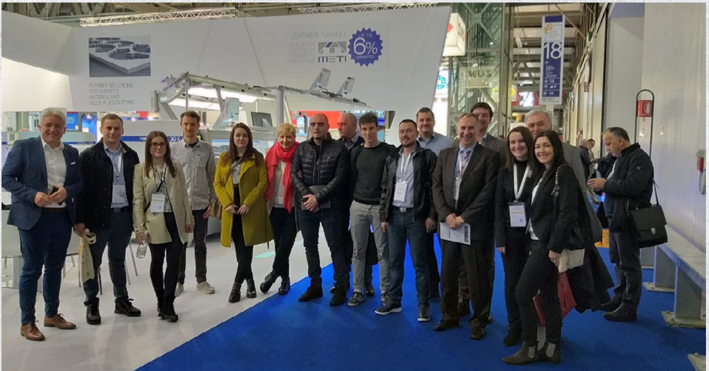
(BH delegacija u posjeti sajmu)

SIMAC Tanning Tech veliki je međunarodni sajam za industriju obuće i proizvoda od kože, najvažnijih sektora trgovinske razmjene i investicija Italije i Bosne i Hercegovine. U saradnji sa Odjelom za promociju ekonomskih odnosa Ambasade Italije u Sarajevu (ICE) i italijanskog Udruženja proizvođača opreme za obućarstvo i kožarstvo - Assomac, bh. delegacija i ove je godine bila gost na sajmu SIMAC 2019. Delegaciju su predvodili sekretari sektorskih Udruženja Privredne komore Federacije BiH i Privredne komore RS.