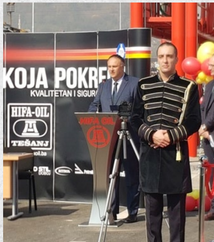
Nakon svečanog otvaranja upriličen je obilazak terminala