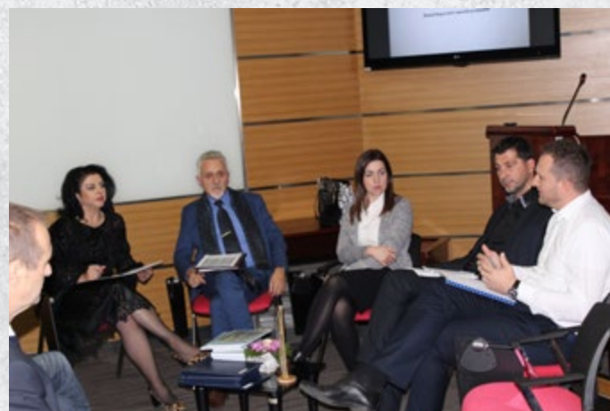
PRAVILNIK O ORGANIZOVANJU I IZVOĐENJU PRAKTIČNE NASTAVE U ŠKOLAMA SREDNJEG STRUČNOG OBRAZOVANJA I KOD POSLOVNIH SUBJEKATA