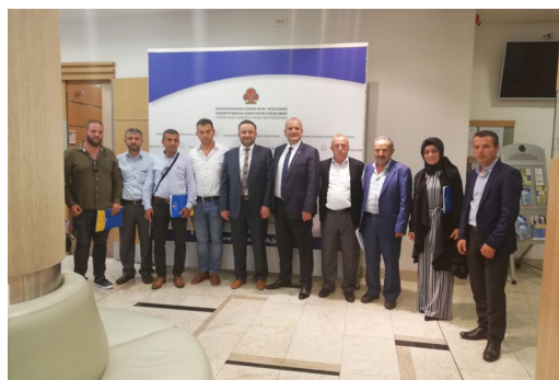
Delegacija privrednika iz Burse