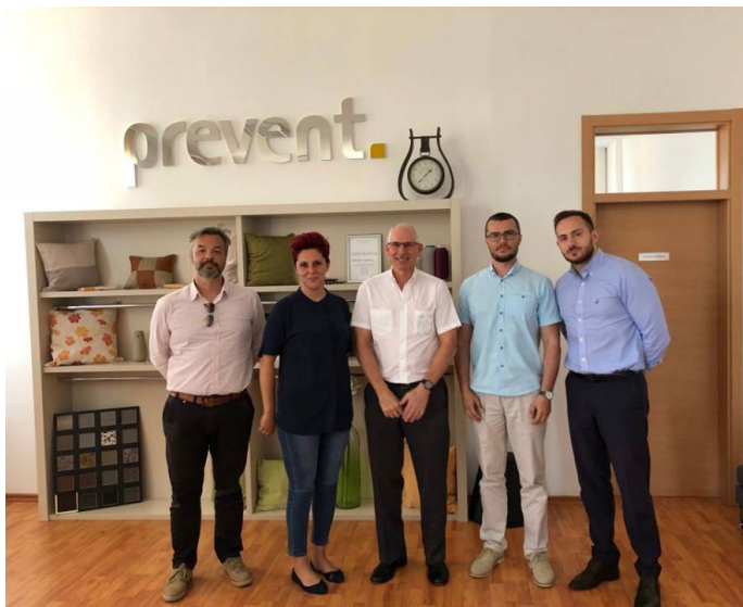
U posjeti Prevent Fabrics d.o.o.