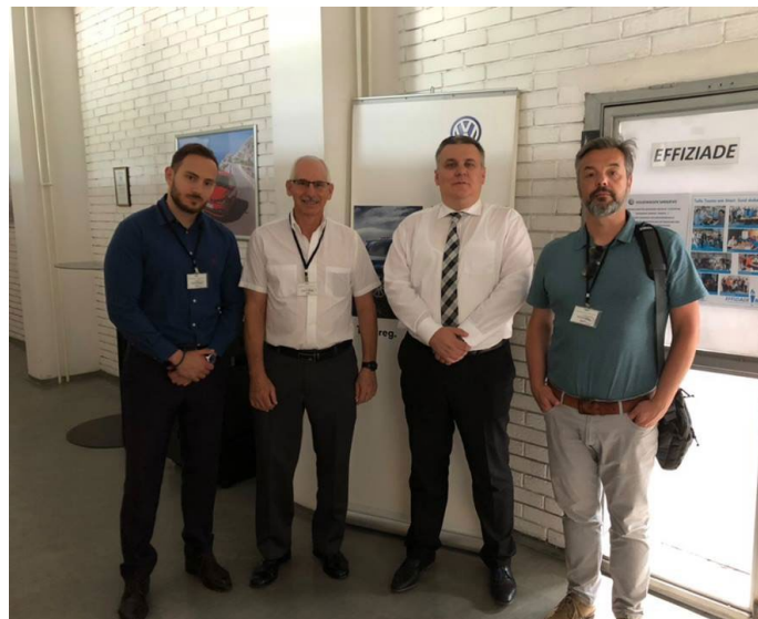
U posjeti Volkswagen d.d.