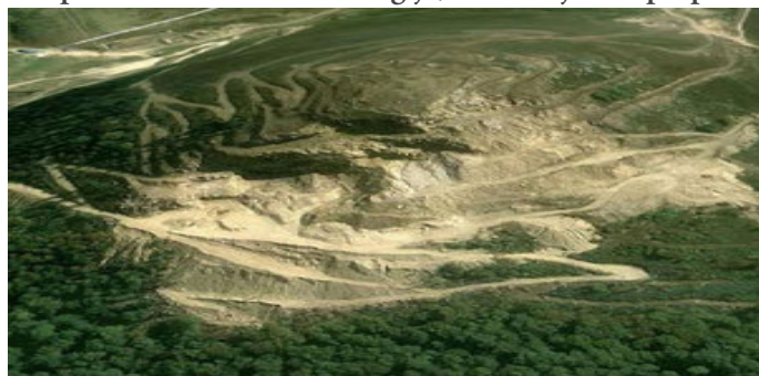
Površinski kop “Smrčevica”