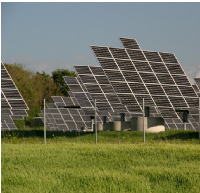
Aktualne i planirane politike vezane uz obnovljivu energiju u BiH

Kako pokrenuti procese izgradnje projekata obnovljivih izvora energije, odnosno, na koji način stvoriti pretpostavke u društvu za prelazak BiH na održivu energiju. Odabrani pristup se mora bazirati na argumentima kako bi se najlakše došlo do prihvatljive energetske transformacije kao strateške odrednice razvoja države, a ne samo kao cilja koji nam je nametnut (npr. kroz EU direktive i/ili međunarodne konvencije) i koji se mora ispuniti. Međutim, problem se često doživljava tako da unaprijed znamo da cilj neće biti dostignut niti energetska transformacija može imati pravi učinak i društvenu korist kao osnovnu odrednicu lokalnog razvoja.