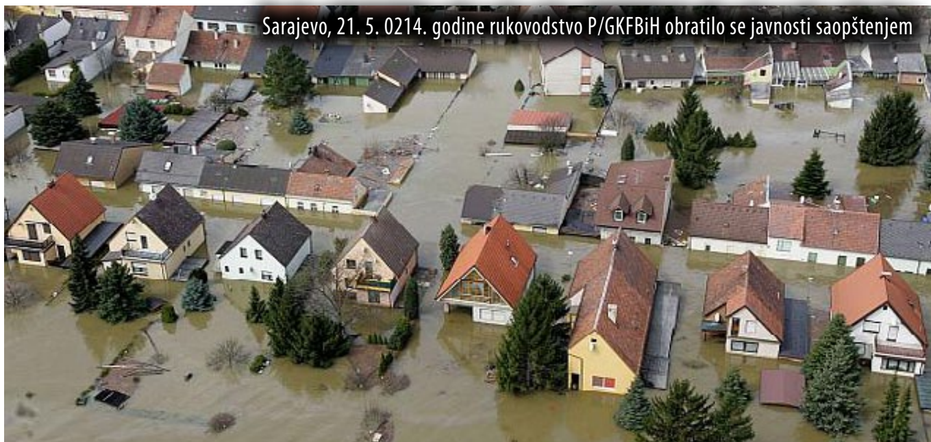
Sarajevo, 21. 5. 0214. godine rukovodstvo P/GKFBiH obratilo se javnosti saopštenjem