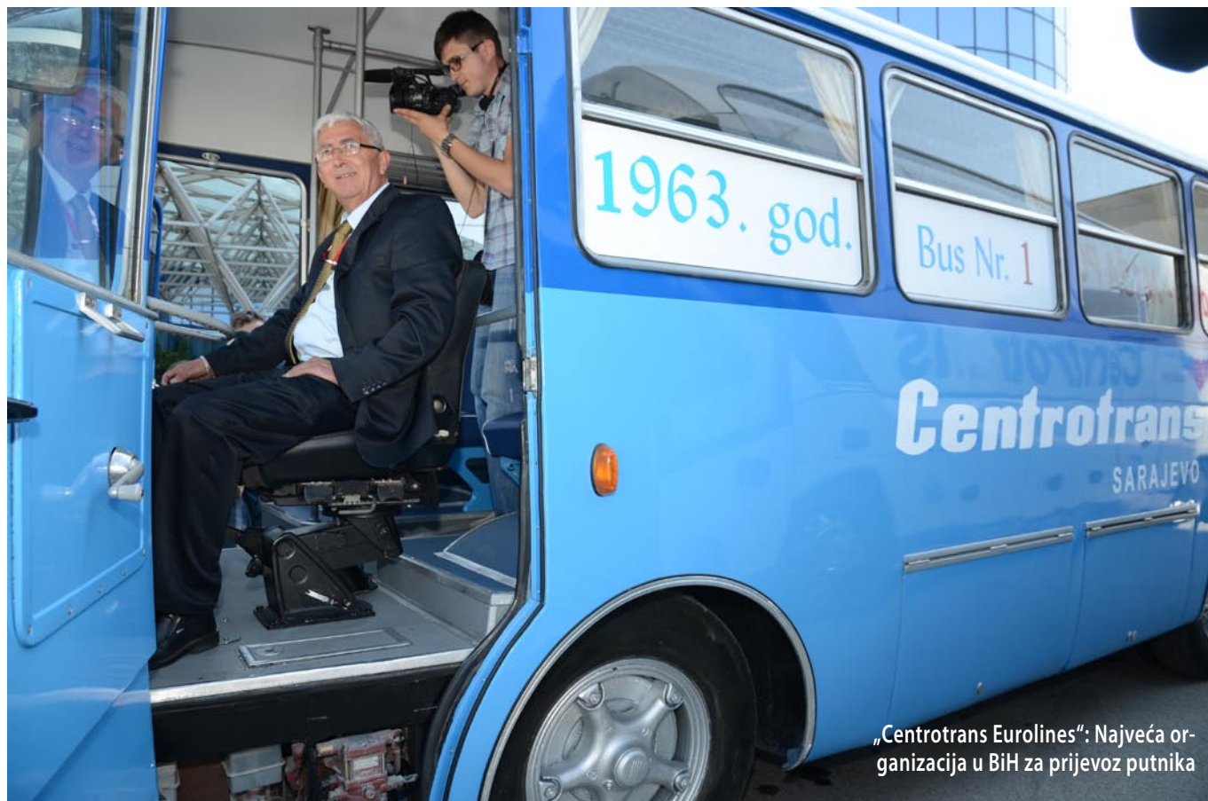
„Centrotrans Eurolines“: Najveća organizacija u BiH za prijevoz putnika

siranje i tehničko održavanje vozila iz programa "MAN", "NEOPLAN" i "ISUZU". Tehnologija rada je zasnovana na najsavremenijim principima i standardima iz okvira djelatnosti kao veoma strogim zahtjevima proizvođača, dok je praćenje i nadzor procesa rada podržan i kontrolisan primijenjenim integralnim informacionim sistemom. U okviru "Centroservisa" otvara se stanica za teh-