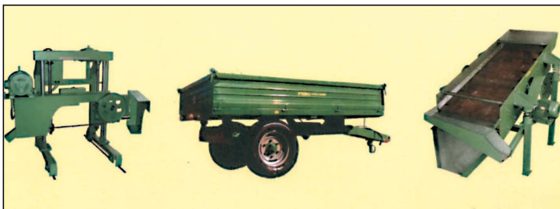
PRIMO: iz proizvodnog programa