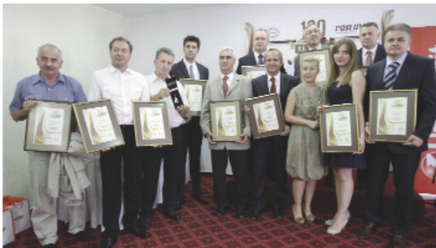
Dobitnici priznanja sa urednicom Poslovnih novina

Svečana dodjela priznanja najuspješnijim kompanijama u Sarajevu okupila je poslovne ljude iz cijele BiH sa ciljem da se promoviše biznis u BiH