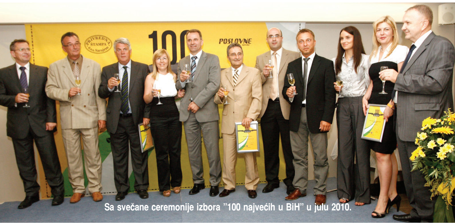
Sa svečane ceremonije izbora „100 najvećih u BiH“ u julu 2010.

Jedinstvene karakteristike Projekta „100 najvećih u BiH“ su tradicija, kredibilitet, objektivnost - jer se rangiranje vrši na osnovu jasno definisanih kriterija; transparentnost - jer se rang-liste sa svim podacima objavljuju u specijalnom izdanju Poslovnih novina; kao i dostupnost - jer se daju jednake šanse svim privrednim subjektima da učestvuju u izboru tako što svaka firma koja želi da bude rangirana može popuniti anketni listić i dostaviti svoje podatke Poslovnim novinama do 10. maja ove godine.